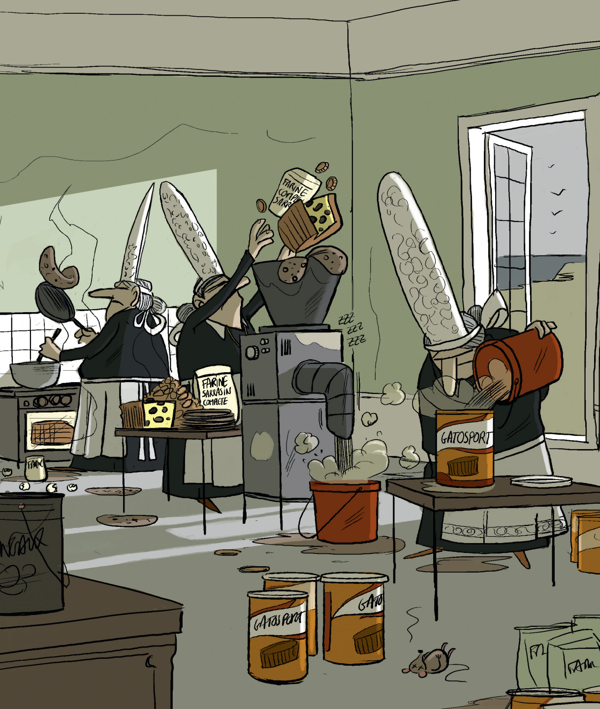
L'ÉLABORATION DU GATOSPORT®